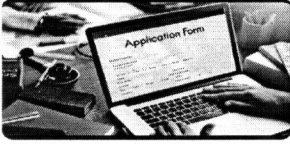
Online Form Fill Up

Online Form Fillup অপশনে ক্লিক করে বিকাশ পেমেেন্ট